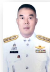
พ.ต.อ.ชลิต ศรีหามู รอง ประธาน กต.ตร.